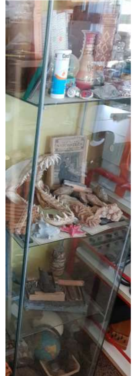
école Bonneveine Marseille